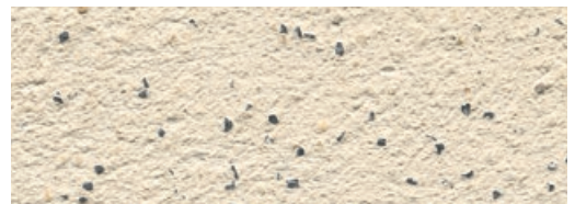
FINISH Dover Weiß mit Nero Ebano